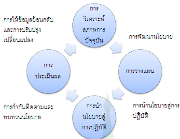
ภาพที่ 1.1 กระบวนการนโยบายการศึกษา

จากแนวคิดดังกล่าวได้กรอบแนวคิดครอบคลุมดังภาพที่ 1.2